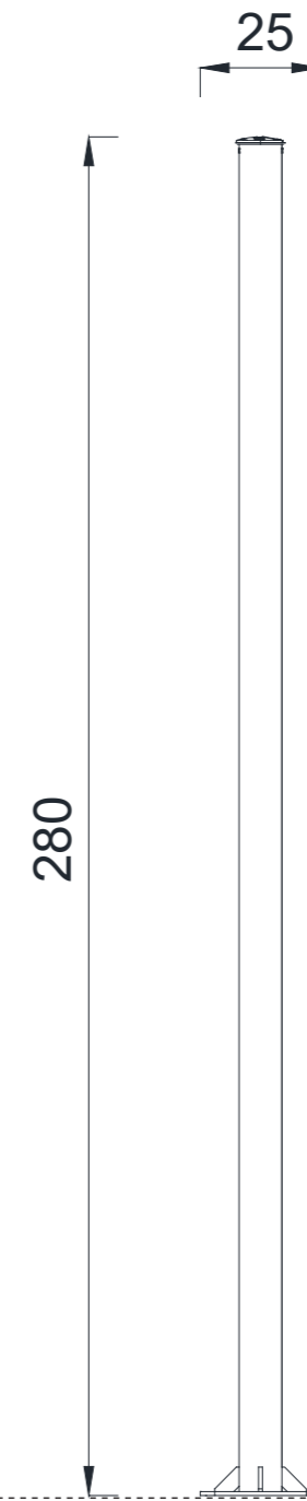
YAN GÖRÜNÜŞ / SIDE VIEW

Gösterilen ölçüler cm cinsindedir / Dimensions shown are in cm